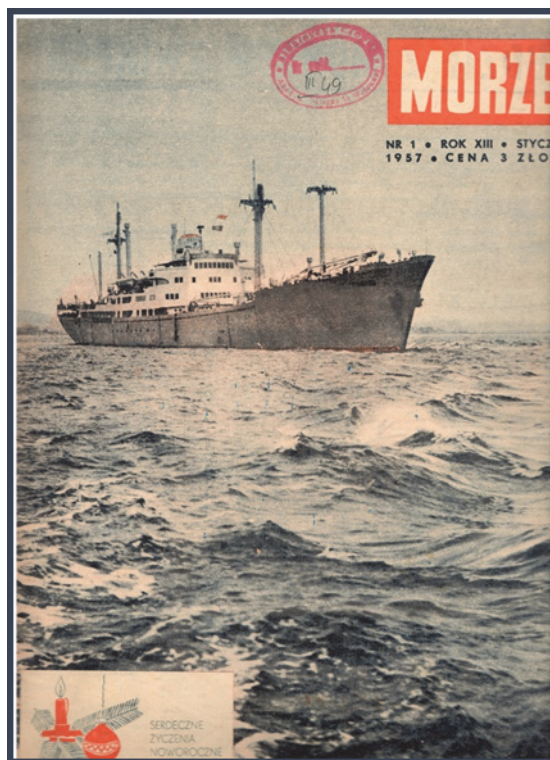
Rys. 1. Winieta periodyku „Morze”